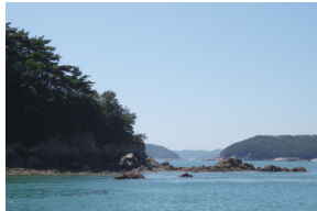
⑫ 소야도 뒷장불