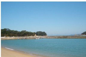
⑬ 소야도 변도 방파제