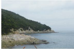
③ 덕적도 파랑금이 갯바위