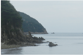
② 덕적도 소재 해변 갯바위