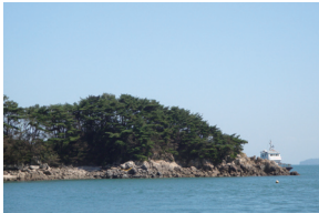
⑥ 덕적도 정자바위