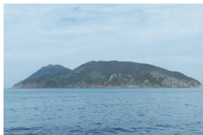
① 선미도 부근