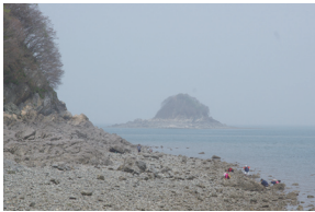
⑭ 구봉도 개미허리 갯바위