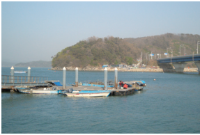
⑩ 선재도 선착장