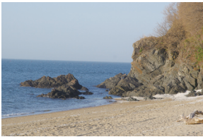
⑤ 십리포해수욕장 갯바위