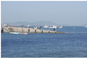
⑥ 진두항 방파제