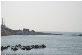
⑬ 대부도 메추리섬 부근