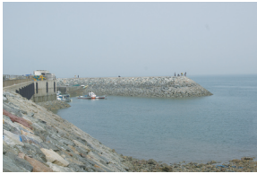
⑫ 대부도 방아(머리) 선착장